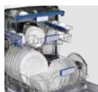
Extra großer und vollvariabler Innenraum

Montage » Hocheinbaubar » Zulaufschlauch hinten links ca. 130 cm » Ablaufschlauch hinten links ca. 140 cm » Seitlich verschraubbar (z. B. bei Granitarbeitsplatte) » Frontjustierung » Von vorn verstellbare Hinterfüße » Höhenverstellbare Füße (+ 5,5 cm) » max. Gewicht Dekorfront 6 kg