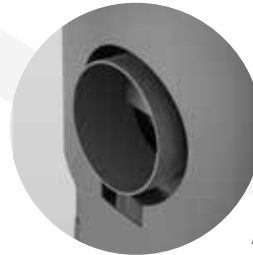
Anschlussstutzen für Verbrennungsluftzufuhr