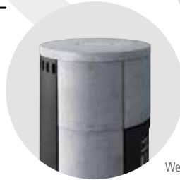
Weitreichende Speckstein- / Keramik- verkleidung (Version Speckstein / Keramik)