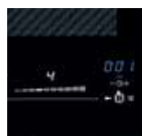
Übersichtlich: Slider-LED weiß, Timer-LED blau